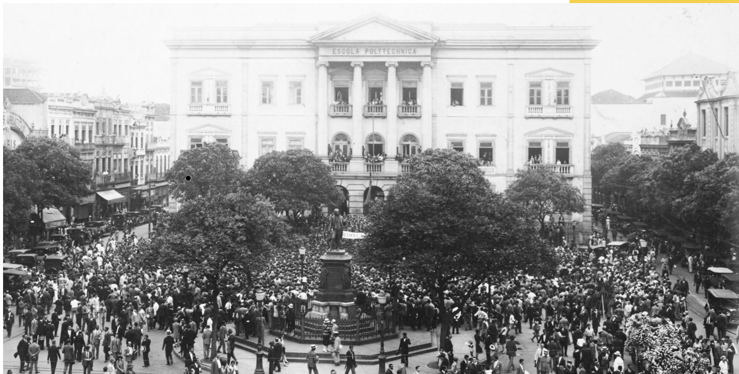
A Sociedade Brasileira de Ciências foi fundada em 1916, na Escola Politécnica do Rio de Janeiro, no Largo de São Francisco.

Presidente da Academia Brasileira de Ciências