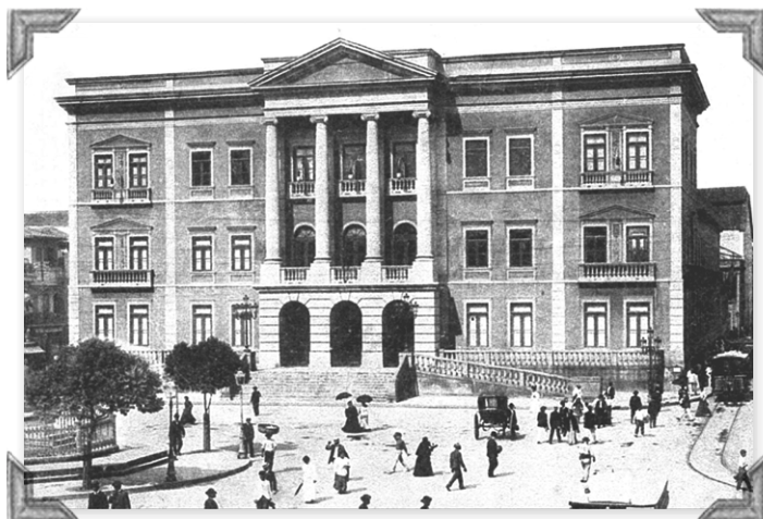
Escola Politécnica do Rio de Janeiro